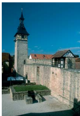
26 + 29