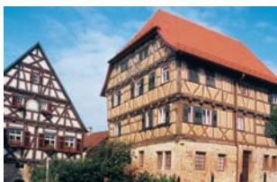
16 und 15